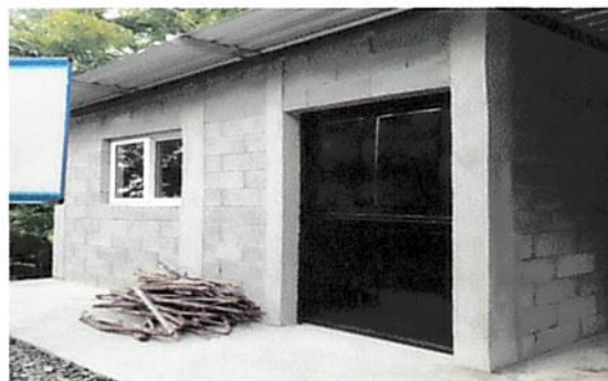
Foto 6: Cerramiento perimetral con block e instalación de puertas metálicas

Observación: Si es necesario se pueden agregar hojas adicionales y actualizar el número de hojas.